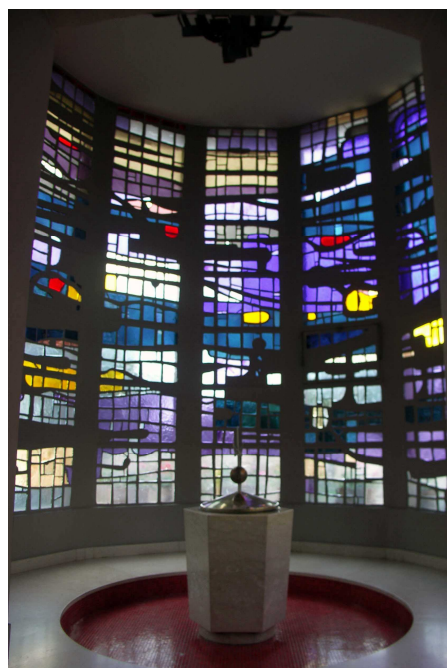
Eglise de Bennwihr, le baptistère avec les vitraux de Paul Martineau.

Aujourd'hui, le baptistère en tant que lieu séparé est remis à l'honneur dans les édifices modernes, comme à l'église du Sacré-Cœur de Mulhouse où à l'église de Bennwihr, avec évocation de la piscine primitive. Cette disposition qui réserve un espace plus important aux fonts baptismaux est bien sûr liée à l'évolution des usages, le baptême des petits enfants n'étant plus célébré le plus tôt possible après la naissance, et souvent au milieu d'une assemblée élargie à la famille et aux amis. Dans l'Eglise protestante, on a conservé l'usage de baptiser à côté de l'autel, souvent pendant le culte dominical 2 .