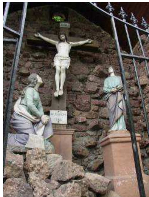
La crucifixion, au sommet du jardin.

Deux éléments entrent dans la composition de l' Oelberg , mais ne se rapportent pas à la thématique du chemin de croix : un édicule abritant la représentation du Christ parlant à la Samaritaine et une grotte de Lourdes.