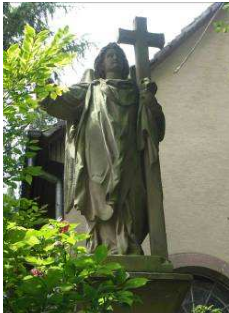
La statue de l'ange surplombant le portail.