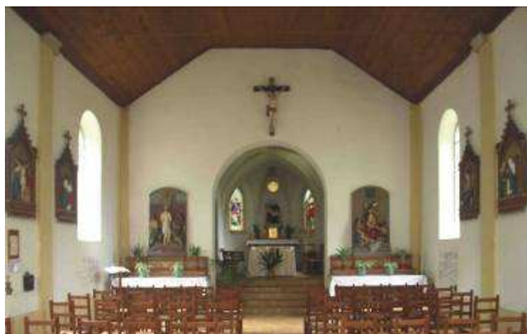
La grande chapelle, dédiée à la Vierge de pitié.