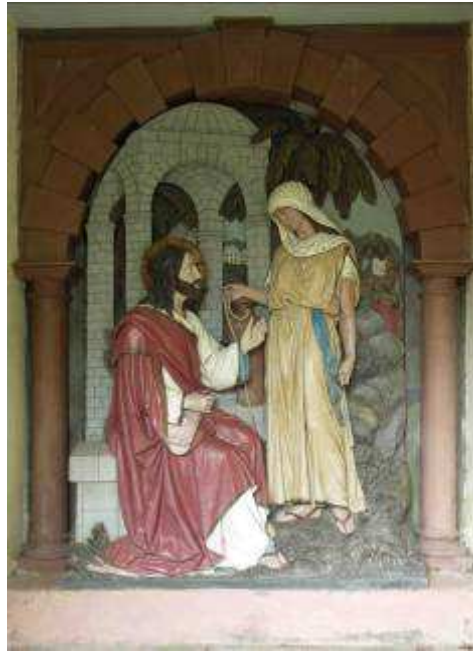
Le Christ et la Samaritaine, scène abritée dans une « fabrique » (à gauche).

La représentation du dialogue entre le Christ et la Samaritaine est peu courante. Sans doute est-ce un souhait pastoral exprimé par le curé qui a suscité la construction de l'édicule et l'acquisition du relief.