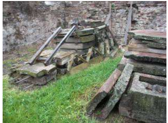
Le chemin de croix et les pierres tombales, en attente de leur mise en valeur.