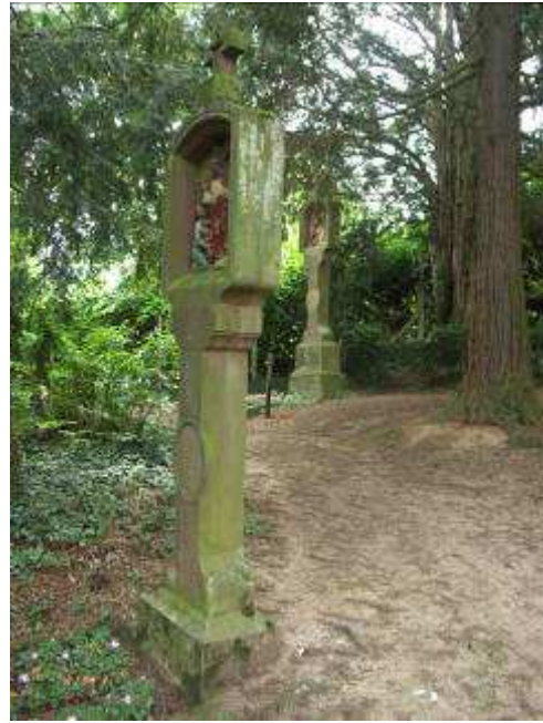
Le chemin de croix sous forme de Bildstöcke, par L. Rousselot, de Guewiller