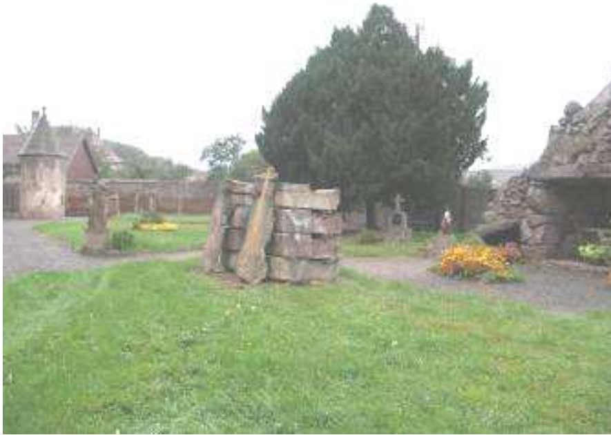
Le jardin, dans son état actuel.