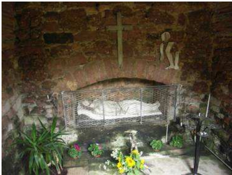
Le Christ au tombeau. On remarque les ex-voto sous la forme de membres suspendus en haut à droite.