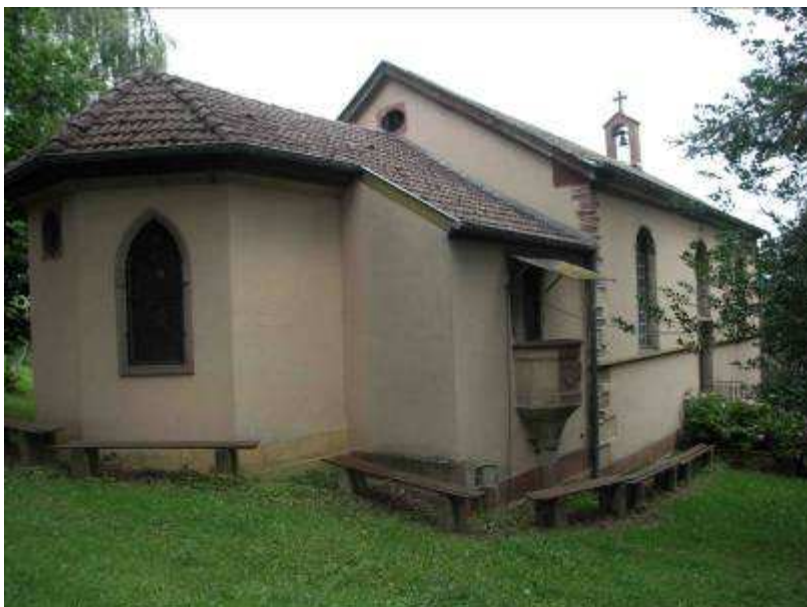
La grande chapelle, avec la chaire extérieure datée de 1597.