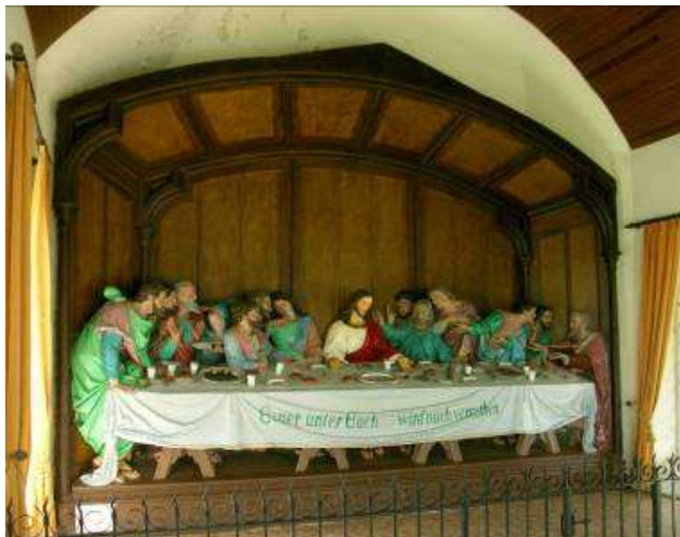
Chapelle de la Cène, avec la reproduction de la fresque de Léonard de Vinci, réalisée par Mayer et C ie , en bois et en ronde-bosse.