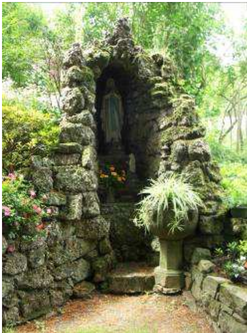
La grotte de Lourdes, avec, transformée en vasque à fleurs, une ancienne cuve baptismale (XVII e siècle ?).

La représentation du dialogue entre le Christ et la Samaritaine est peu courante. Sans doute est-ce un souhait pastoral exprimé par le curé qui a suscité la construction de l'édicule et l'acquisition du relief.