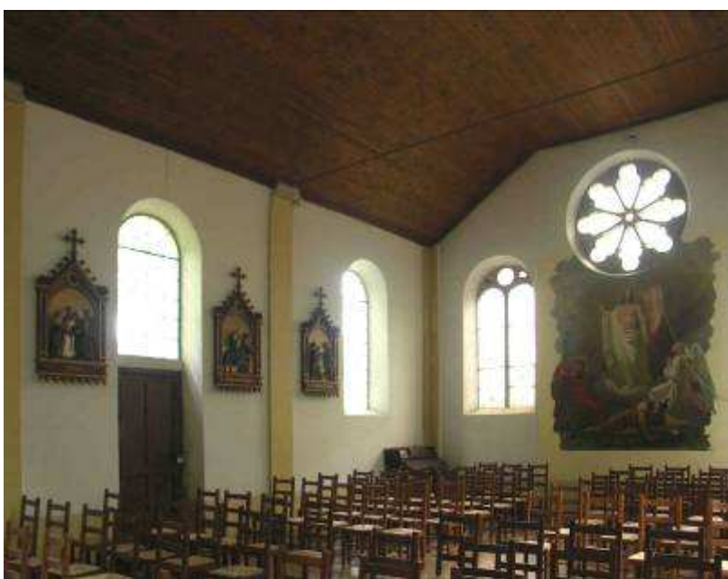
La nef de la grande chapelle. Sur le mur du fond, toile marouflée, peinture par Troxler : la Résurrection du Christ.