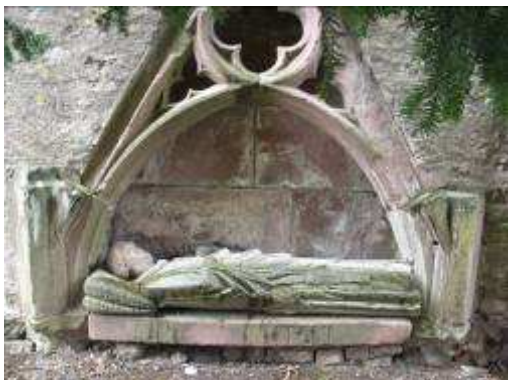
Dans le mur de clôture, gisant d'un ecclésiastique.