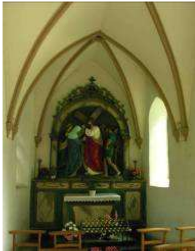
Première chapelle, abritant une station : Jésus rencontre sa Mère.