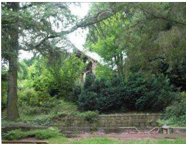
Le terre-plein à côté de la grande chapelle.