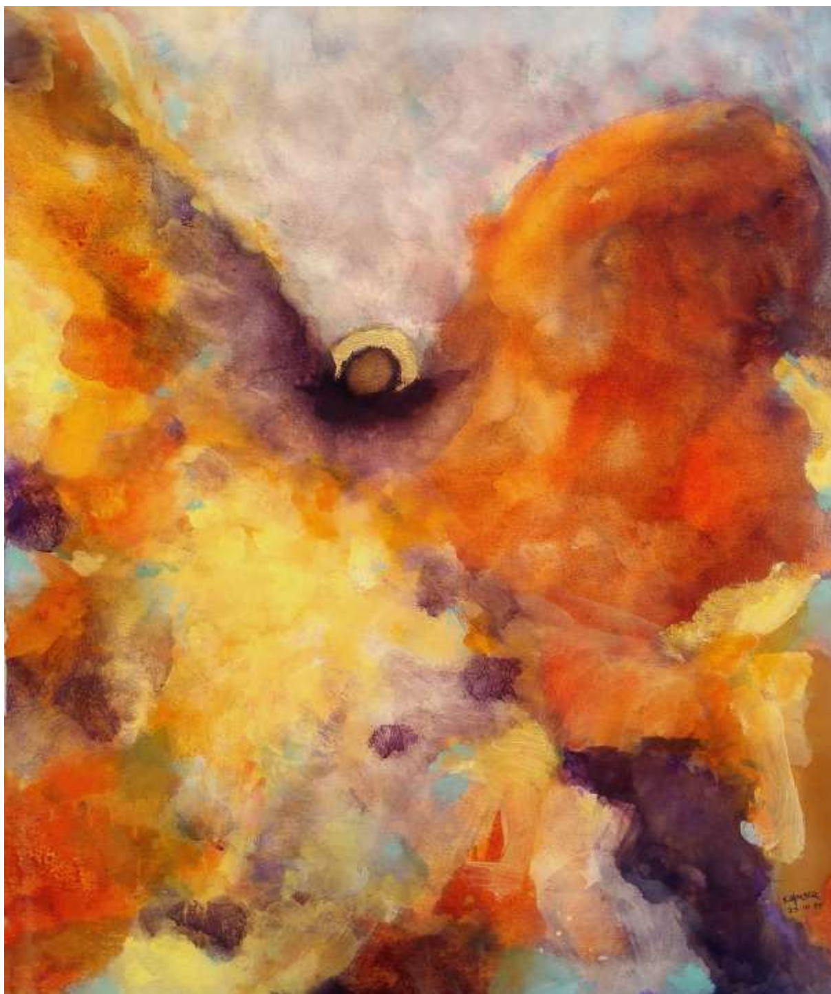
Un ange peint par Sylvie Lander