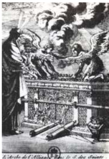
L'arche d'alliance, d'après une gravure du XVIII e siècle.

Le judaïsme n'accepte pas les représentations de figures humaines. Aussi ne connaît-on pas de représentation d'anges, sauf sur l'arche d'alliance dont le couvercle est orné de deux séraphins dont les ailes déployées entourent la Présence invisible de Dieu.