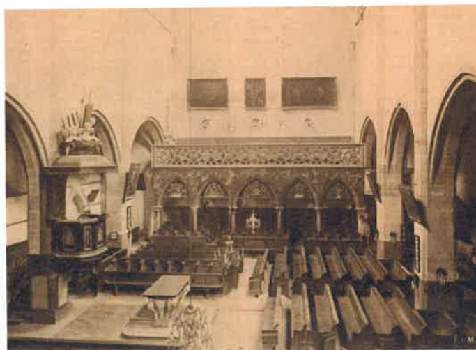
Aménagement de la nef après 1681.

- Une église partagée après l'annexion en 1681 de la ville de Strasbourg par Louis XIV et l'imposition en Alsace du simultaneum . En fait l'église ne sera jamais simultanément utilisée par les deux communautés, mais un mur séparera le chœur réservé aux catholiques et la nef confiée aux protestants.