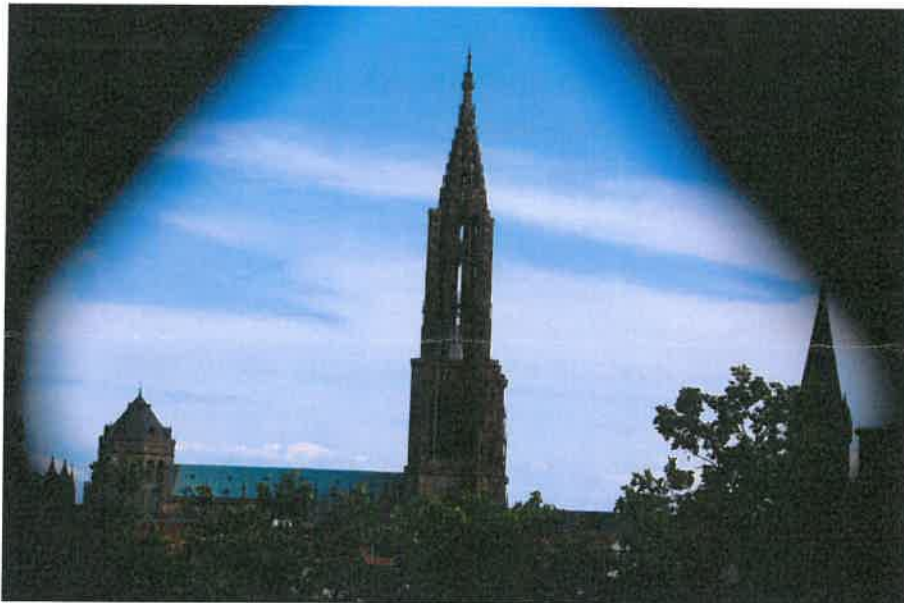
Vue de la tour de Saint-Pierre-le- Jeune