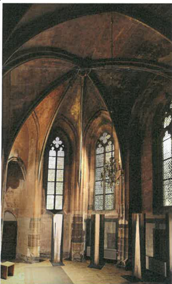
Chapelle Saint Jean