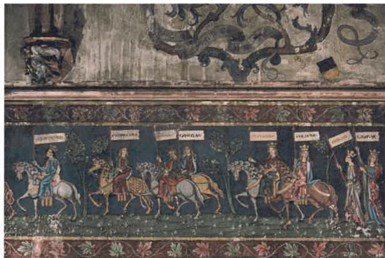
Le cortège des nations

- Une nef peinte , et dont les peintures ont été largement restaurées par Karl Schaefer