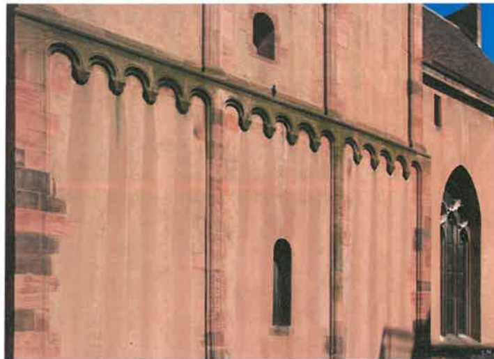
Vue des restes de l'église romane du 11 e

Les origines de l'église remontent au 7 e ou au 8 e siècle ; elle a connu la présence de moines irlandais, elle a été reconstruite par l'évêque Guillaume dans la première moitié du 11 e siècle, puis confiée à un chapitre de chanoines, bourgeois de la ville, et consacrée par le pape Léon IX.